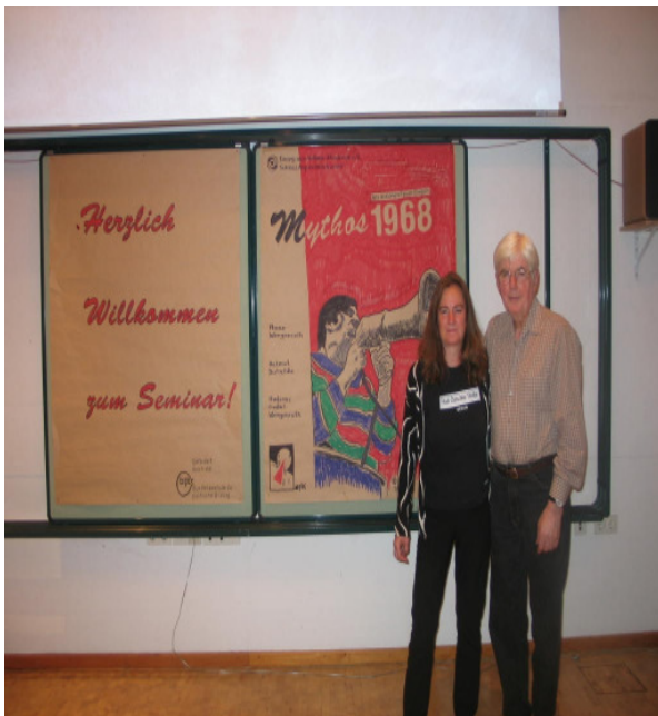
14. Februar 2011